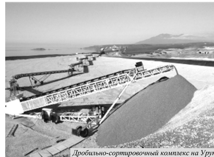
Дробильно-сортировочный комплекс на Урупе

ства была проведена плановая проверка специалистами Ростехнадзора. В его акте было несколько замечаний в наш адрес, которые мы быстро устранили. Сейчас ожидаем выдачи заключений на завершение